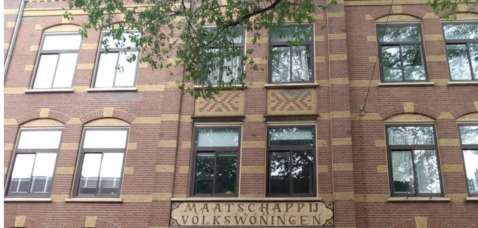
Zou Ymere kabouters hebben ingezet als antikraakwacht?