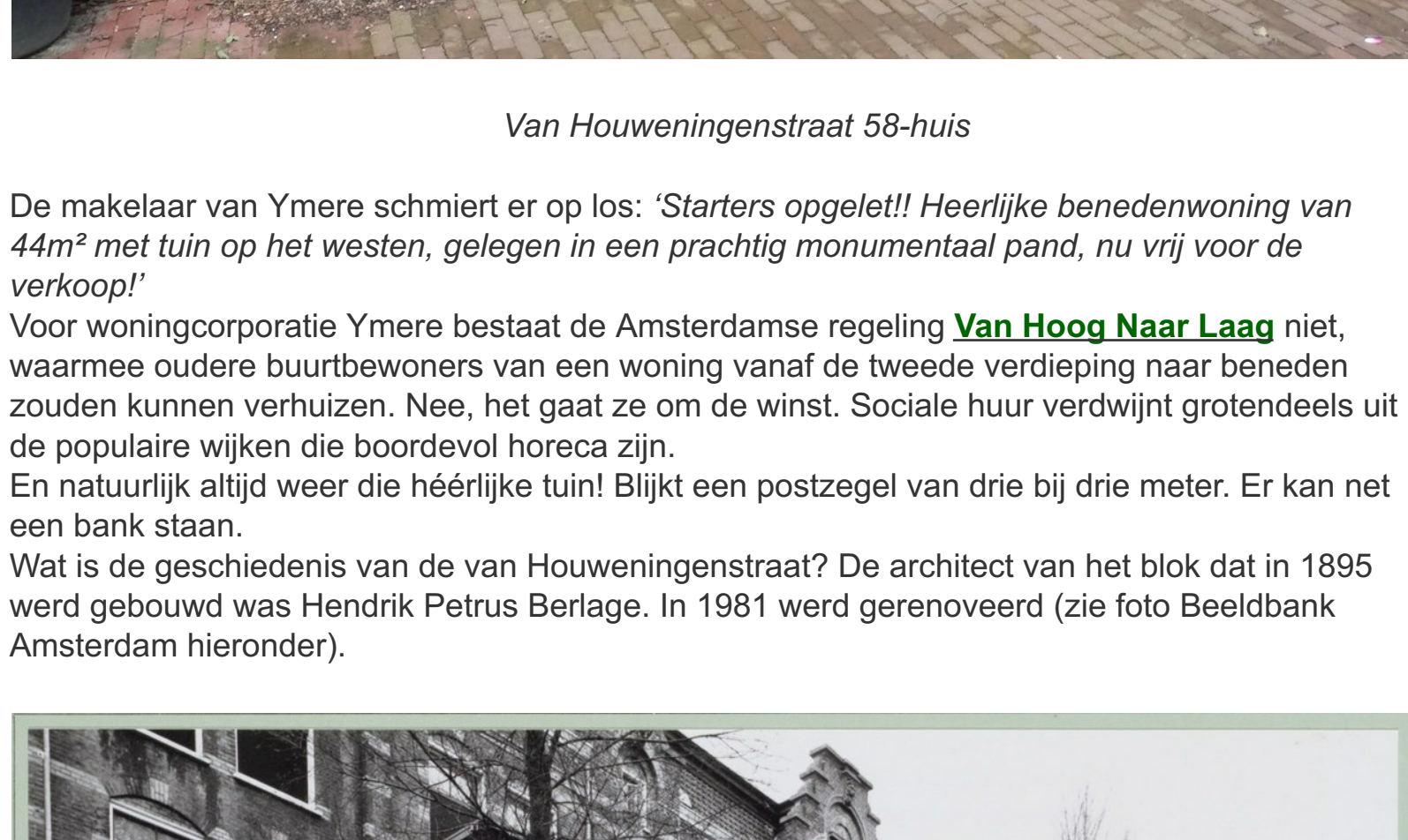
Van Houweningenstraat 58-huis

Andere corporaties lijken beter bij de les. Schoorvoetend komen nu woningen te huur te staan die voorheen in de verkoop zouden zijn gegaan. De Key: Burgemeester Tellegenstraat 37-1 en Coöperatiehof 12-1 . Alliantie: Amstelkade 49-huis . Uit complexen waar de laatste jaren alles werd verkocht wat vrij kwam.