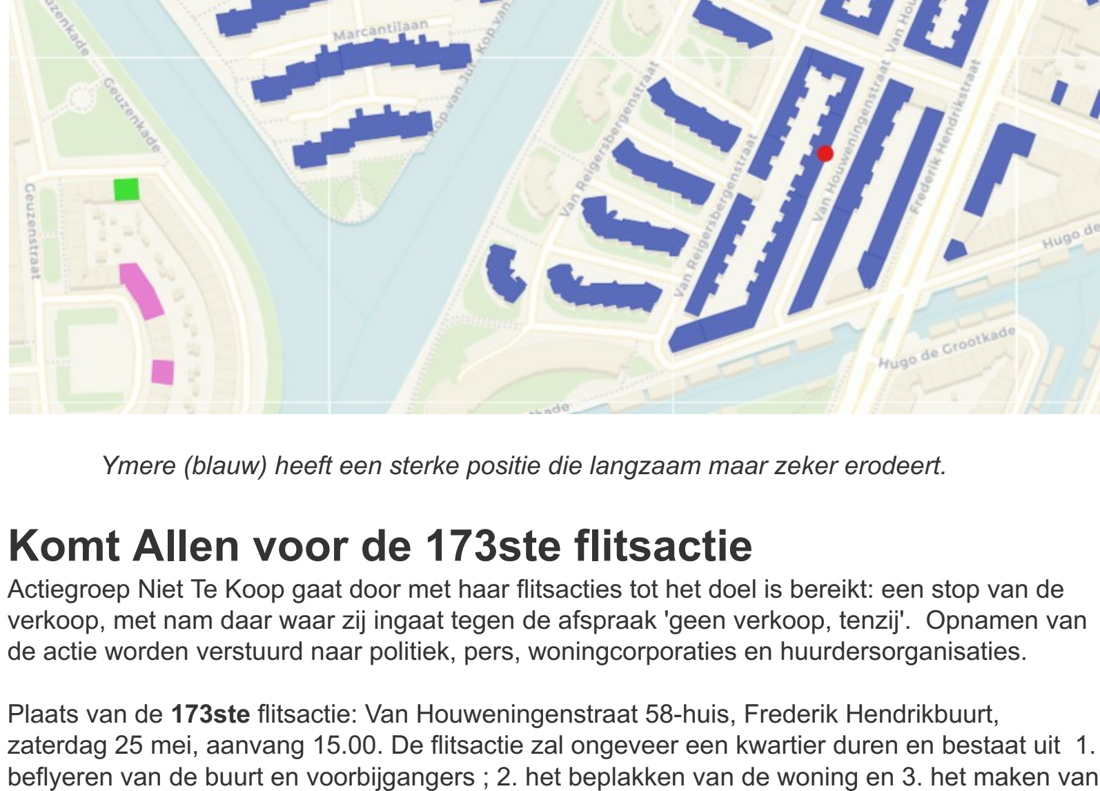
Ymere (blauw) heeft een sterke positie die langzaam maar zeker erodeert.

De gemeente Amsterdam moest geld bijleggen, even later kocht de Gemeente Amsterdam het gehele complex op en gaf het beheer over aan de laterlijke Woningdienst Amsterdam .