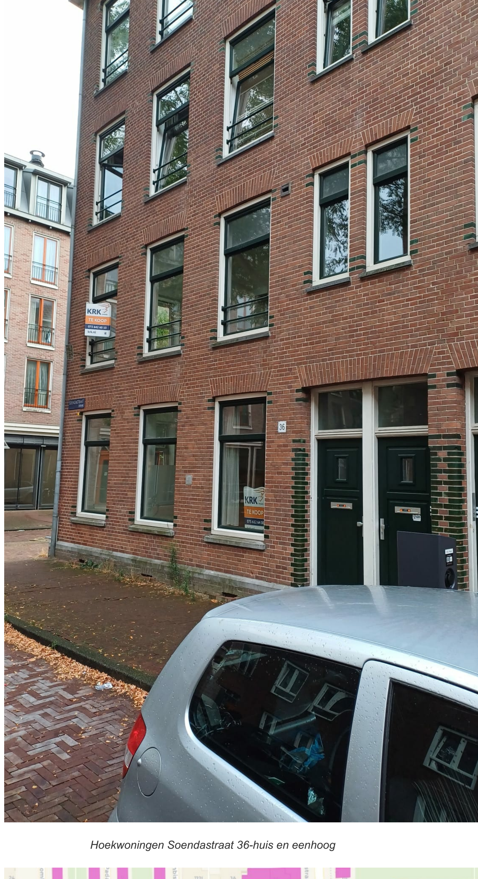
Hoekwoningen Soendastraat 36-huis en eenhoog

'Gezellige Indische Buurt' is te vertalen in 'Een eeuw lang bestond de buurt voornamelijk uit sociale huur. Dat is verleden tijd. De sociale woningen worden verkocht en overal komt horeca.'