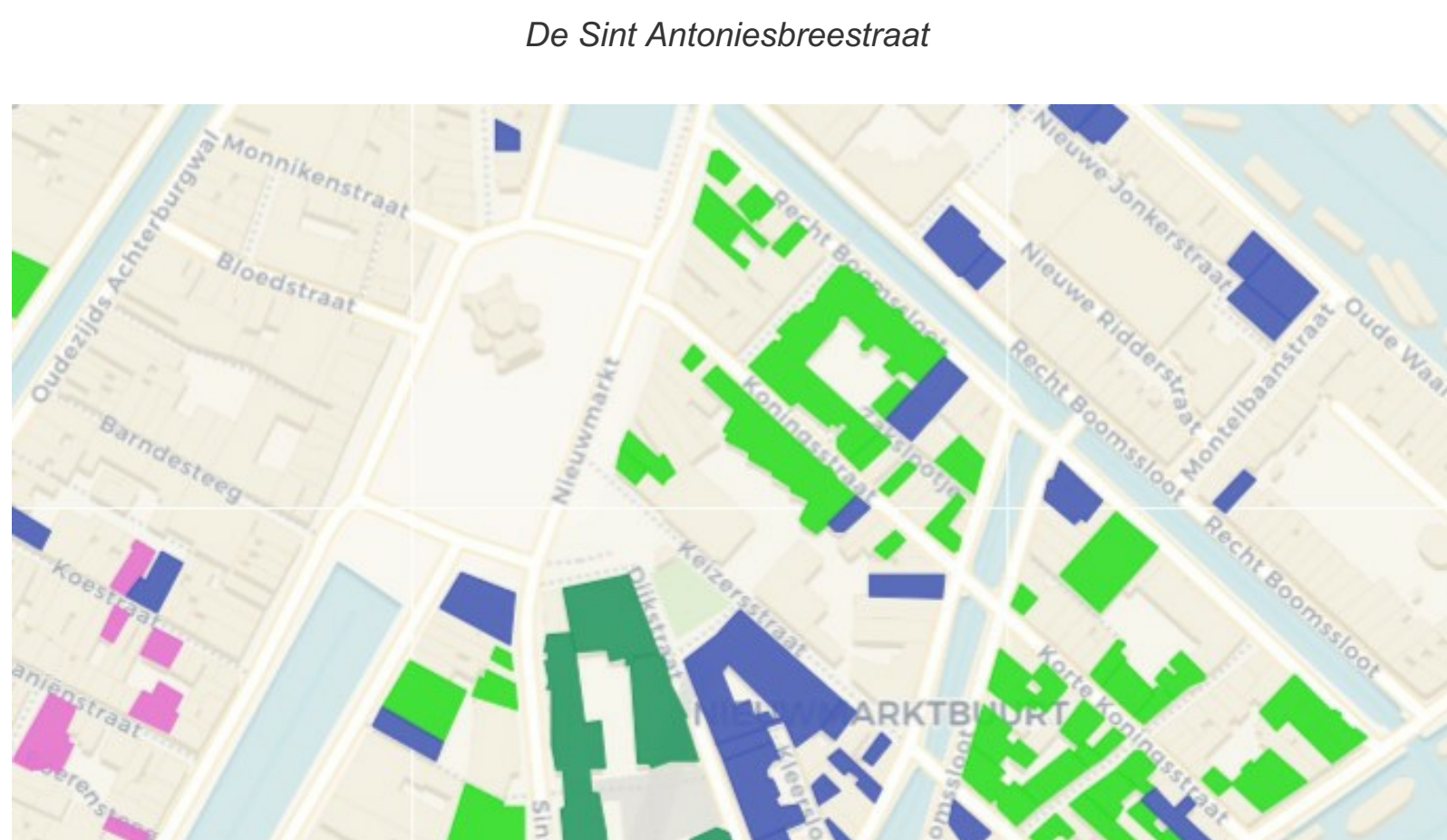
De Sint Antoniesbreestraat

Bebouwing vanaf 1600. Levendige volksbuurt met sterke menging wonen-werken. Al snel ook de Amsterdamse Jodenbuurt. Rond 1930 sanering onder andere op Uilenburg. Tijdens en na de oorlog afbraak door niet terugkeren van Joodse bevolking. Het wederopbouwplan 1953, de aanleg van de IJ-tunnel en tenslotte metrobouw zorgen voor heftige acties. Met succes. Een geplande snelweg over het metrotracé vervalt: woningen worden teruggebouwd. In 1988 worden de laatste woningen op het metrotracé opgeleverd. Buiten het metrotracé een aanpak als in de Jordaan: nieuwbouw en restauraties in clusters tot één bouwproject samengevoegd. Restauraties worden gefinancierd als woningwetmonument, waardoor de huren gelijk zijn aan de nieuwbouw.