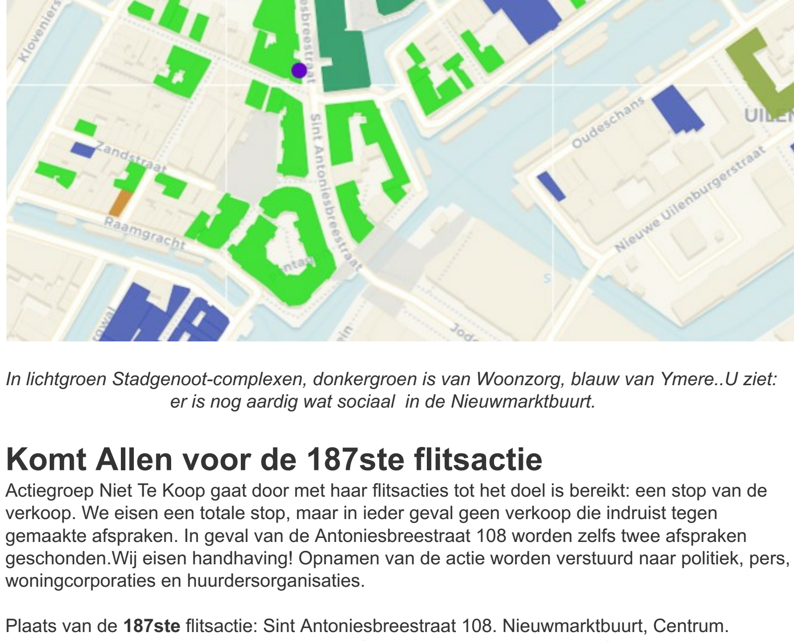
In lichtgroen Stadgenoot-complexen, donkergroen is van Woonzorg, blauw van Ymere..U ziet er is nog aardig wat sociaal in de Nieuwmarktbuurt.