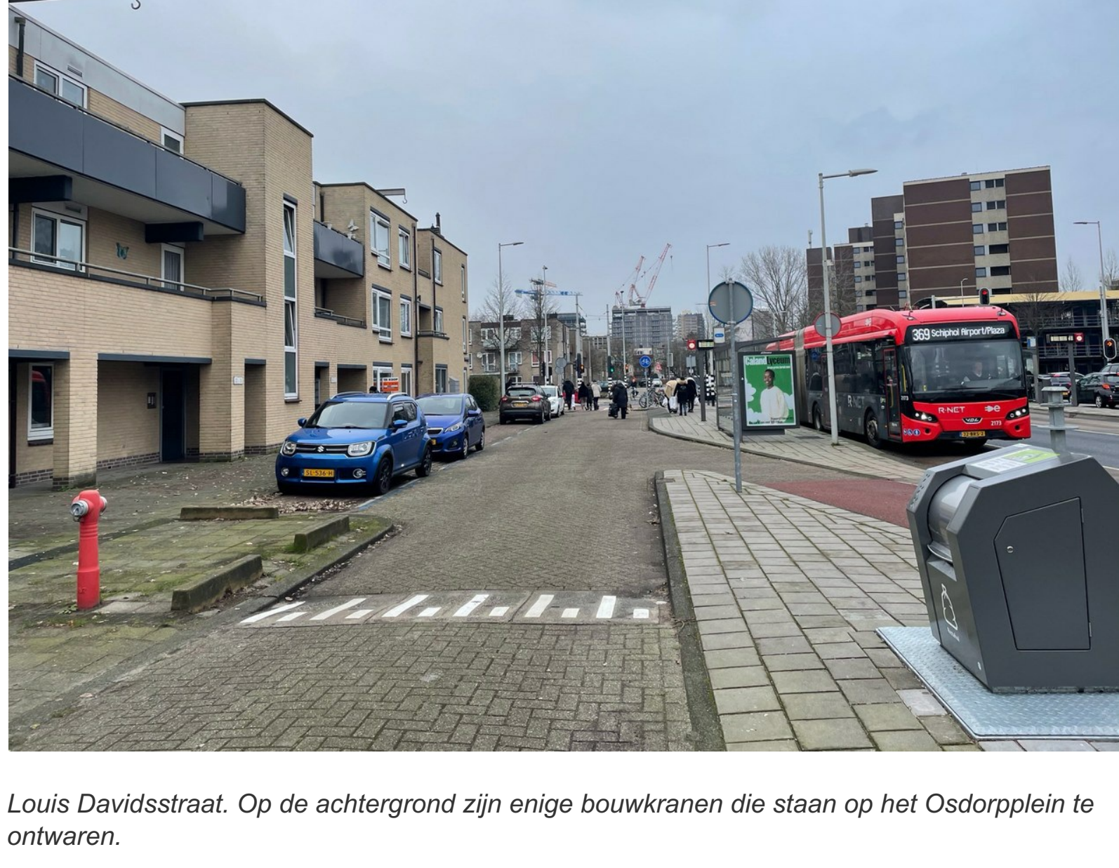
Louis Davidsstraat. Op de achtergrond zijn enige bouwkransen die staan op het Osdorplein te ontwaren.