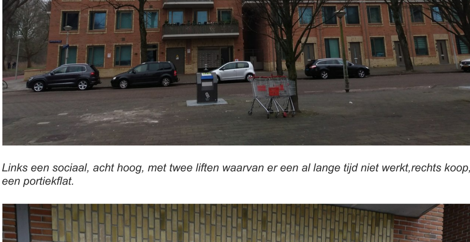
Links een sociaal, acht hoog, met twee liften waarvan er een al lange tijd niet werkt, rechts koop, een portiekflat.