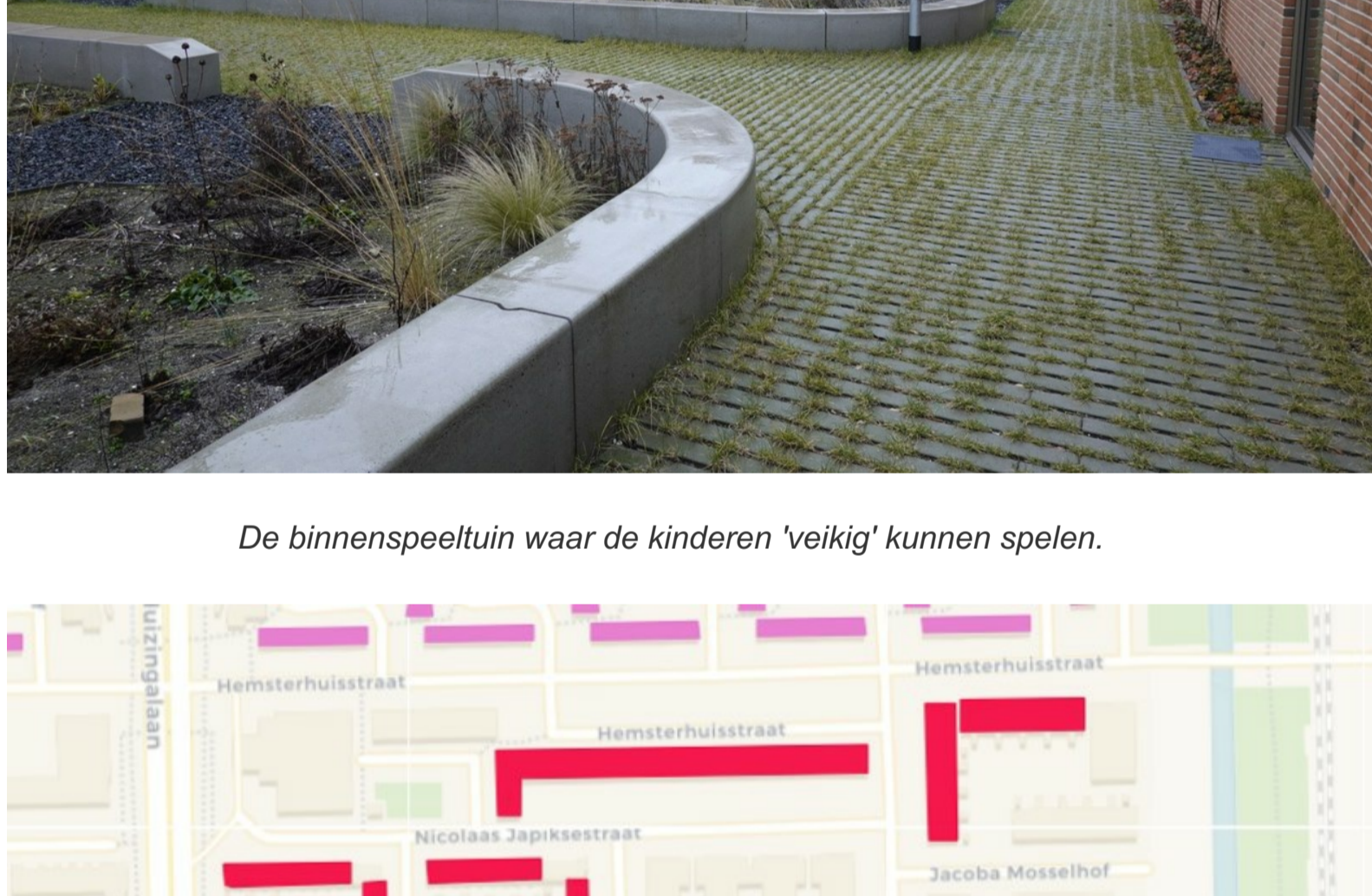
De binnenspeeltuin waar de kinderen 'veilig' kunnen spelen.