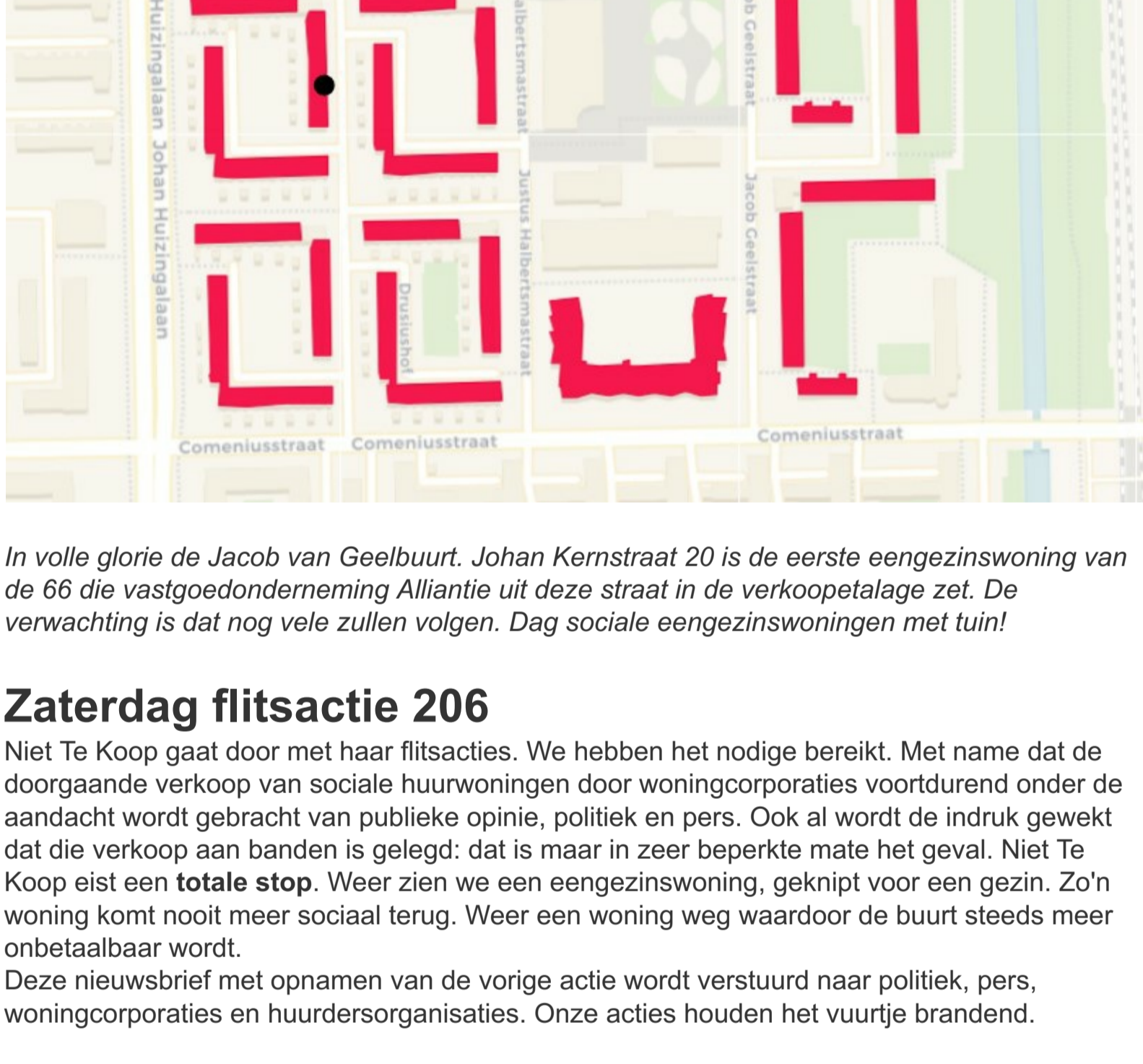
In volle glorie de Jacob van Geelbuurt. Johan Kernstraat 20 is de eerste eengezinswoning van de 66 die vastgoedonderneming Alliantie uit deze straat in de verkoopetage zet. De verwachting is dat nog vele zullen volgen. Dag sociale eengezinswoningen met tuin!