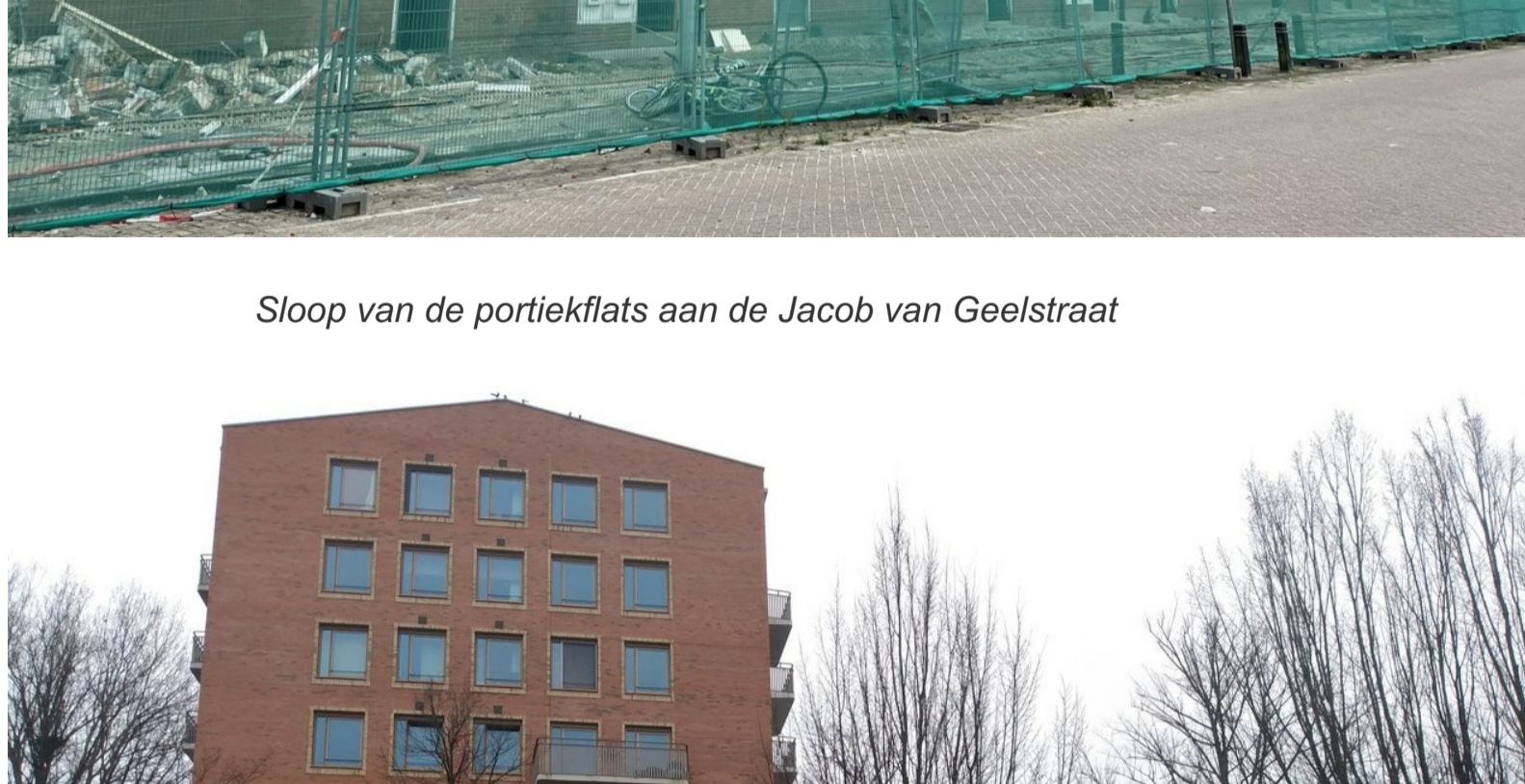
Sloop van de portiekflats aan de Jacob van Geelstraat