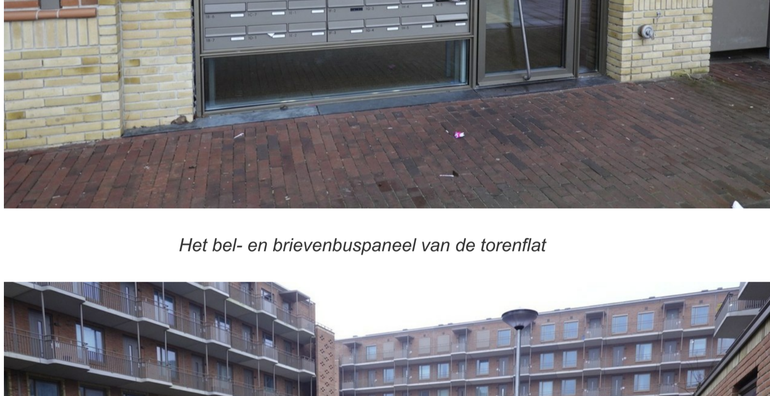
Het bel- en brievenbuspaneel van de torenflat