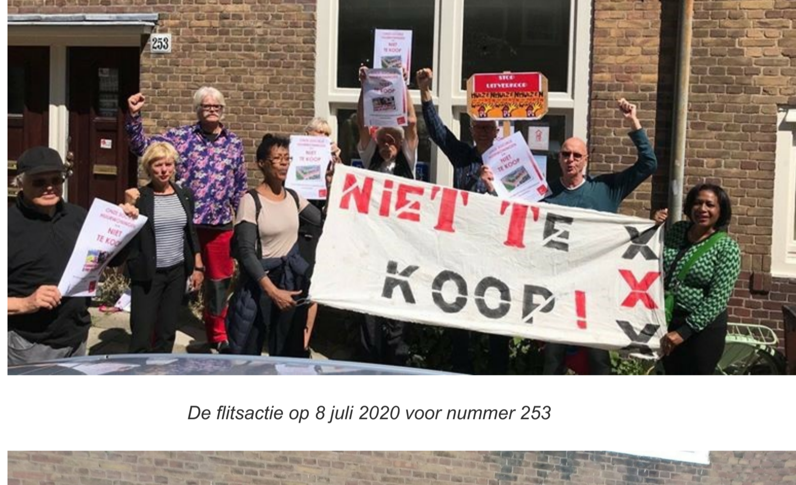
De flitsactie op 8 juli 2020 voor nummer 253