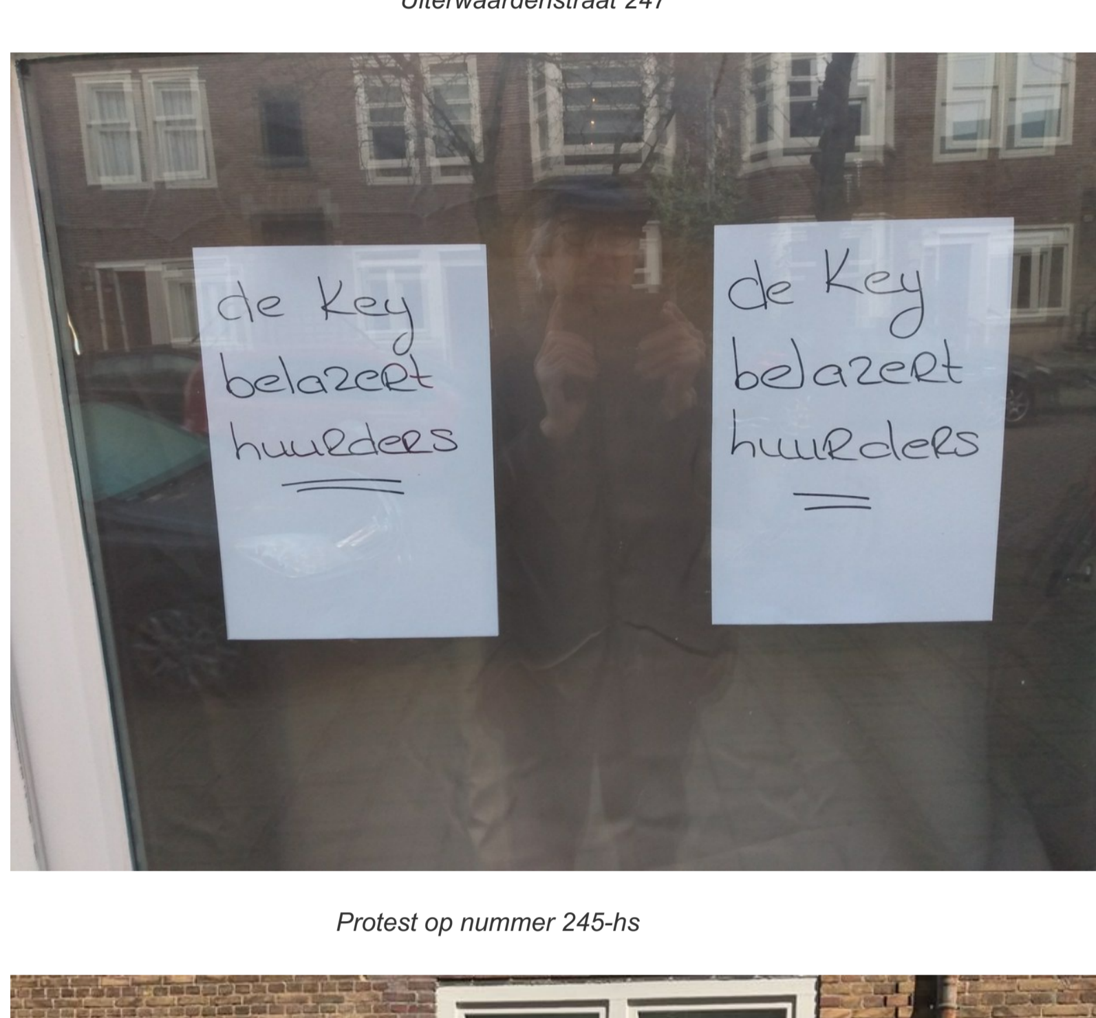
Protest op nummer 245-hs